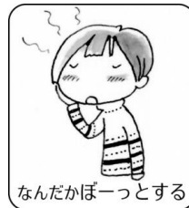
なんだかぼーっとする