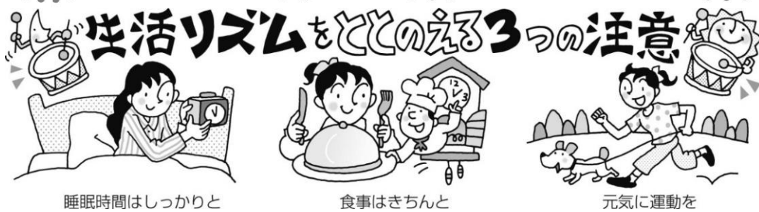
睡眠時間はしっかりと

夏休みは楽しいことがたくさんあります。つい夜ふかしをしたり、お昼までねたり、ゲームばかりしたり…。生活のリズムが乱れやすくなります。できるだけ学校があるときのように規則正しい生活を心がけましょう。そうすると、夏バテ知らずで元気に過ごせますよ!また、規則正しい生活は、新型コロナウイルス感染症をはじめとする感染症の予防にもつながります。元気いっぱい2学期をむかえましょう!!