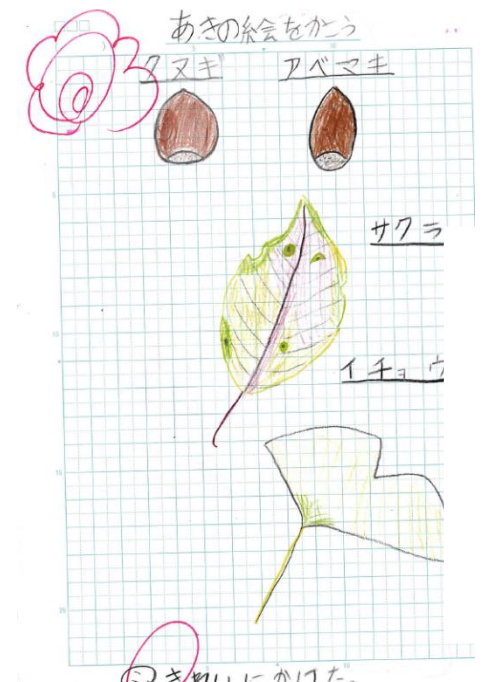
④見つけたものを観察して絵をかきました。本や図鑑で調べたことを書き加えると知識が広がります。

日々の体験から気づいたことを書くことで、文章の表現力を身につけることができます。