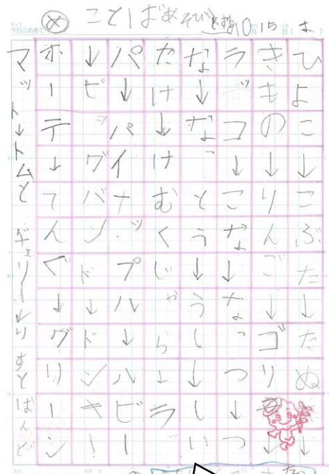
②いろいろな言葉を集めています。

いろいろな言葉を集めています。ひらがなやカタカナを使って皆さんの言葉を書きました。