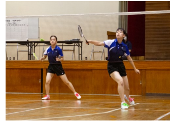
(女子) バドミントン部