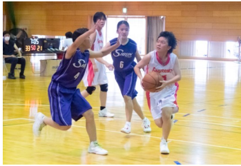
(女子) バスケットボール部