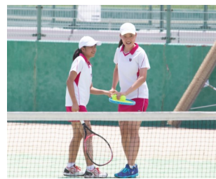
(女子) 硬式テニス部