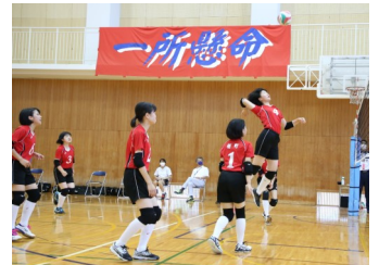
(女子) バレーボール部