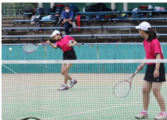
(女子) ソフトテニス部