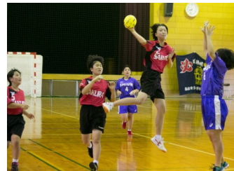
(女子) ハンドボール部