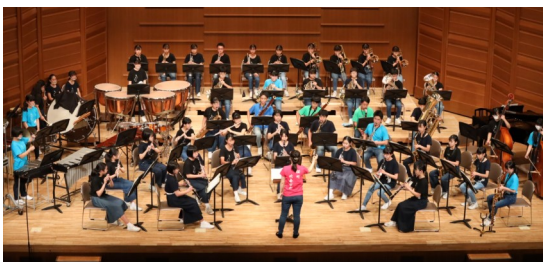
吹奏楽部 (定期演奏会)

新型コロナウイルス感染防止のため、総体やコンクールが中止になる中、運動部については一部を除いて代替の取組が実施され、吹奏楽部は定期演奏会、合唱部は練習会を開催しました。ご家族の皆様方、感染症予防などにご協力いただきありがとうございました。生徒たちの活躍の様子を、写真でお伝えします。