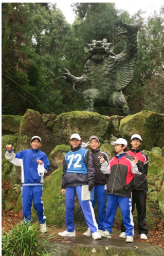
根香寺 牛鬼の呼吸！