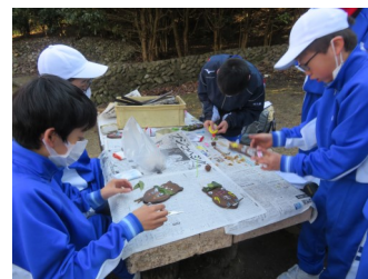
絵の具でペイント