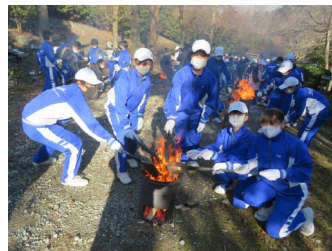
焦がせ具合が肝心 【焼き板】