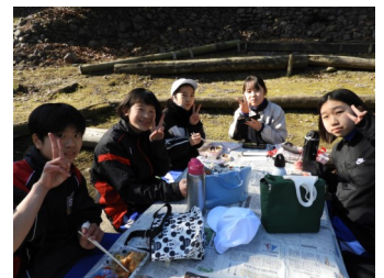
お弁当おいしくいただきます