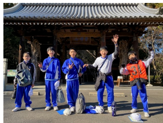
根香寺山門【オリエンテーリング】寒さに負けず山道を行く