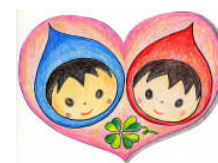
マスコットキャラクター 「にこにこえがおちゃん」