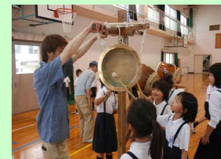
3・4年 祭りグループ 「太鼓打ち体験」