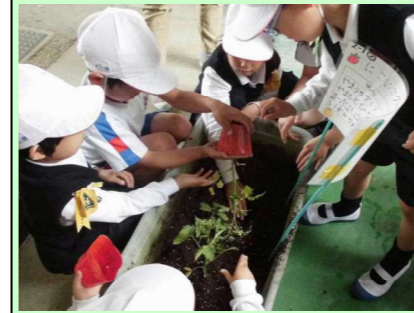
1・2年 生活科 「トマトの植え付け」

水曜日の2・3校時を生活科・総合的な学習の時間と位置づけ、全校一斉に「十河の香り活動」に取り組んでいます。この「十河の香り活動」は、十河地域の「水や緑」「歴史や文化」「人の技」に視点を当て、地域のよさ(香り)について調べたり家庭や地域の方と一緒に活動したりすることを通して、地域の発展を願い子どもたちなりに地域創生に取り組もうとする探究的な学習です。