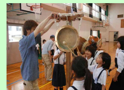
3・4年 祭りグループ 「太鼓打ち体験」