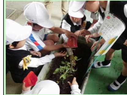
1・2年 生活科 「トマトの植え付け」

水曜日の2・3校時を生活科・総合的な学習の時間と位置づけ、全校一斉に「十河の香り活動」に取り組んでいます。この「十河の香り活動」は、十河地域の「水や緑」「歴史や文化」「人の技」に視点を当て、地域のよさ(香り)について調べたり家庭や地域の方と一緒に活動したりすることを通して、地域の発展を願い子どもたちなりに地域創生に取り組もうとする探究的な学習です。