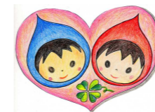
マスコットキャラクター 「にこにこえがおちゃん」