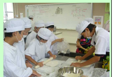
5・6年 麦・うどんグループ 「うどんづくり体験」