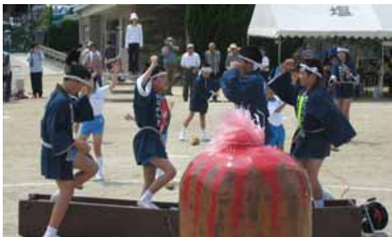
保存会のみなさんと踊る

伝統を受け継ぎ、残すことは、地域の一員としてたくましく生きる子どもを育てることと実感しています。地域のよさをますます見直して参りたいと存じますので、よろしく御願います。