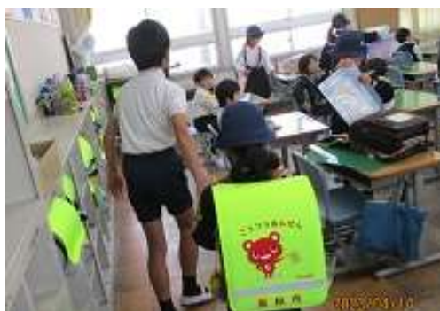
〈新入生の困り感に寄り添いながら温かいサポートをする6年生〉

これらを本年度の教育構想の軸として、「個を伸ばし、学び合う集団へと成長させる教育活動」の実現に向け、教職員一同、力を尽くして参ります。保護者の皆様には本年度もよろしくご支援賜ります様、心よりお願い申し上げます。