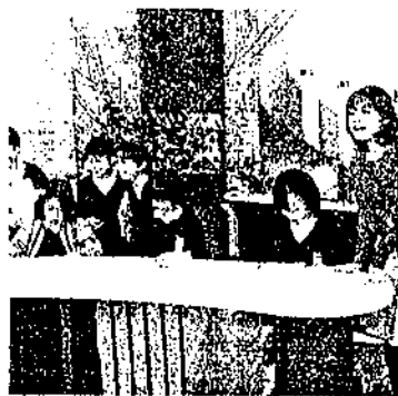
五年生瀬戸内海放送見学