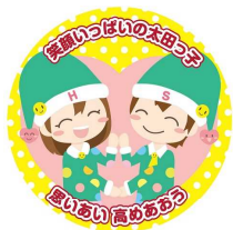
マスコットキャラクター