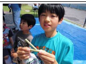
二つの竹を組み合わせて笛の完成