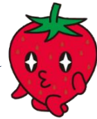
ごじまんキャラクター イチゴ娘

今月の給食に登場するいちごは、高松市の農林水産課から無料でいただきました。「さぬきひめ」という香川県のオリジナル品種です！