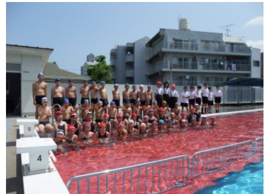
底板を入れて練習したプール

昨日から新たにスタートを切りました。今月は学習面も、まとめの時期に入っていきます。陸上もありますが、少しずつ学校のペースにあわせながら、疲れをとって休養し、勉強にも力を注ぎましょう。