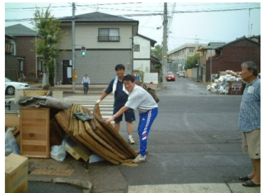
水につかった畳や家具が山盛り

災害は、いつ起こるか分かりません。いざというときにきばきとした行動が取れるように災害を忘れないようにしましょう。