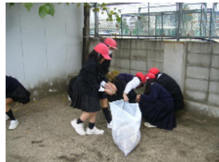
↑すみずみまで掃除しました

子どもたちは、公園にごみがほとんど落ちていないことから、公園を使う人がきれいに利用していることや、定期的に清掃している人の存在に気付きました。自分たちもマナーを守って利用したいという意識が高まっていました。