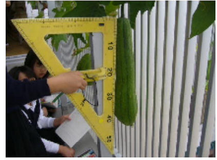
↑育ったヘチマの大きさと実の数の多さにびっくり！

子どもたちは、理科での実験にとっても意欲的です。これまでに、アルコールランプ、ガスバーナーなど多くの実験器具の扱い方を学習しました。マッチをすった経験のない子も無事に点火でき、達成感にあふれる笑顔を見せていました。水が沸騰していく様子などにも興味津々で、結果について考察し、意見を出し合っって科学的な見方を学んでいます。