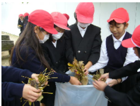
↑協力してたくさんの落ち葉を集めました