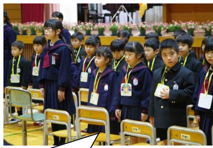
これからどうぞよろしくをお願いします。