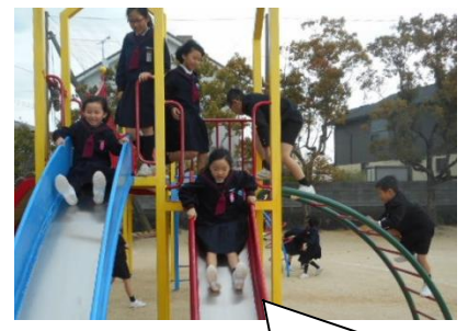
6年生は優しくてうれしかったよ。