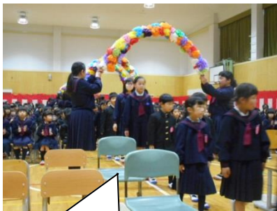
入学式は、どきどきしたよ。

4月11日（水）に入学式があり、1年生がなかま入りしたことをみんなでお祝いしました。担任の先生から自分の名前を呼ばれると、1年生は「はい」と大きな声で上手に返事ができていました。入学式後のたんぼぼ集会では、6年生と1年生がペアとなって、一緒に遊具で遊んだり、教室でお絵かきをしたりして、楽しく過ごしました。