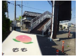
▲ 歩道橋を渡ります。 手前の押しボタン信号は 使いません。