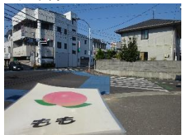
▲ 横断歩道を渡ります。 自動車や自転車に気を つけましょう。