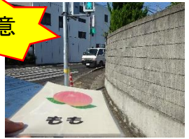
見通しが悪いので、気 をつけましょう。