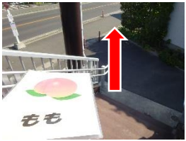
歩道橋を渡ったら、左側 の歩道へ進みます。