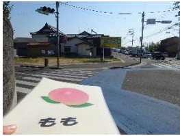
▲ 横断歩道を渡ります。 自動車や自転車に気を つけましょう。