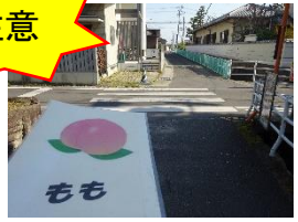
▲ 横断歩道を渡ります。 自動車や自転車に気を つけましょう。