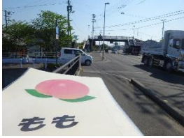
▲ 橋を渡ります。 左折する自動車にも気を つけましょう。