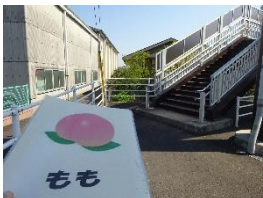
▲ 歩道橋を渡ります。 この先にある押しボタン信 号は使いません。