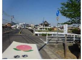
▲ 橋を渡ります。 風が強いとき、帽子が飛 ばされないように気を つけましょう。