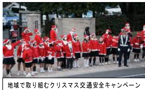
地域で取り組むクリスマス交通安全キャンペーン