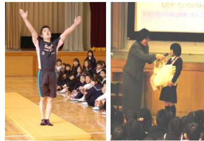
子どもたちが楽しみにしている夢集会