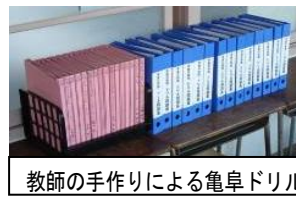
教師の手作りによる亀阜ドリル