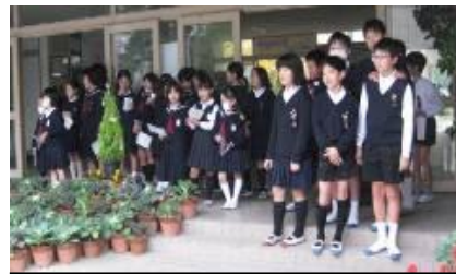
児童会が中心になって取り組むあいさつ運動