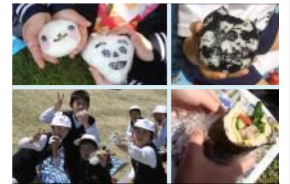
手作りおにぎりマイランチの日