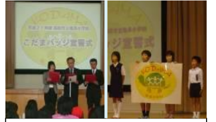
保護者・地域・教師も参加するこだま宣誓式