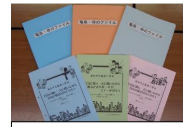
命のノート(交通・遊び・不審者編)