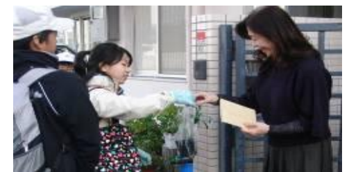
年2回、育てた花を持ってSOS宅訪問