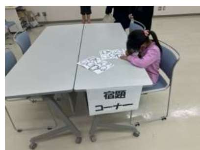
【宿題&お絵描きコーナー】