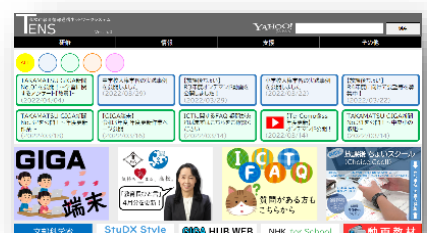
TENS 内部ホームページ