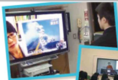
▶博物館の学芸員に、疑問に思ふことを説明してもらおう

オンライン学習を含む遠隔教育が注目されています。本市においてもICT環境の整備の一環として、各校のZoomライセンスを取得しました。国の「遠隔教育システム導入実証研究事業」『遠隔教育システム活用ガイドブック第2版』では、遠隔教育の可能性について次のように示されています。各学校におけるビデオ会議システムの活用に向けて、参考にしてください。また、実施にあたって不明な点があれば、お気軽に総合教育センターにご相談ください。