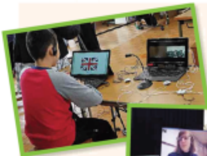
▶▶ 他校の児童と英語で会話する